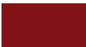
3R3 Červená - Barcelona*