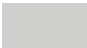
1F7 Stříbrná - saténová*